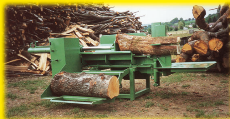
Fendeuse T26 en position travail